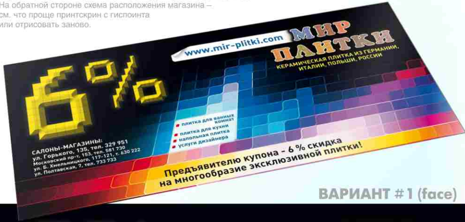
ВАРИАНТ #1 (face)

см. что проще принтскрин с гислоинта или отрисовать заново.